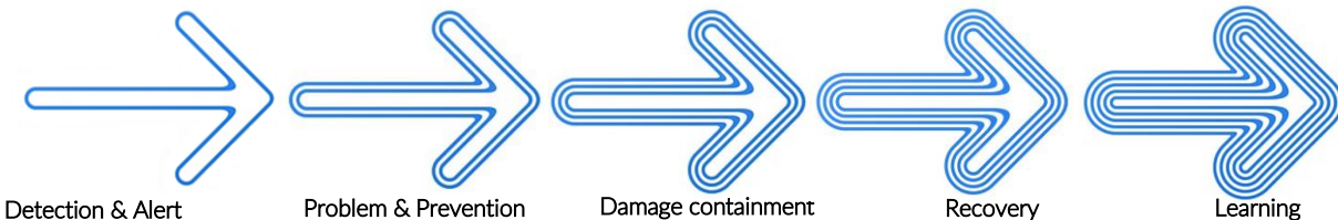
Mitroff's Five Stages of Crisis Management